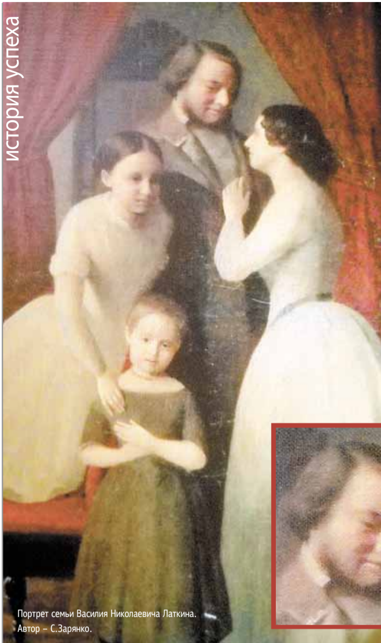
Портрет семьи Василия Николаевича Латкина. Автор – С.Зарянко.